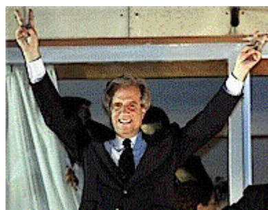
Tabaré Vázquez trionfa in Uruguay

La vittoria alle elezioni regionali senza dubbio rende possibile la avanzata del programma della Rivoluzione Bolivariana, significa la sconfitta della vecchia classe politica e apre il cammino alla