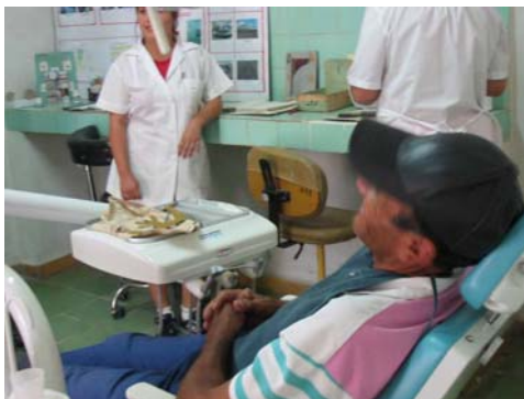
Stomatologico di Manatì (provincia di Las Tunas)

In primo luogo occorre segnalare che la sanità è gratis dal livello base, seguita dal medico di famiglia fino ai trattamenti più complessi come possono essere un trapianto di cuore , una chirurgia plastica o un trattamento di infertilità.