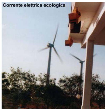
centrali eoliche a Moron

Grazie anche alla Associazione Nazionale Amicizia Italia/Cuba si stanno costruendo impianti per il recupero degli scarti della fermentazione della canna da zucchero (per produrre il rum) e trasformarli in biogas.