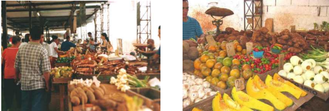
Mercado Agropecuario Estatal “La Caridad” Havana

La rivoluzione ha introdotto il principio, di assicurare a tutta la popolazione un'alimentazione adeguata in calorie e in proteine, che possa essere alla portata di qualsiasi cittadino, indipendentemente dal salario o dalle oscillazioni dell'offerta e della domanda del mercato. Per ottenere questo si è istituita “La Libreta” ( il libretto) di approvvigionamento attraverso la quale si assegna a ciascuna persona una quota degli alimenti principali, a prezzo politico sussidiato dallo Stato.