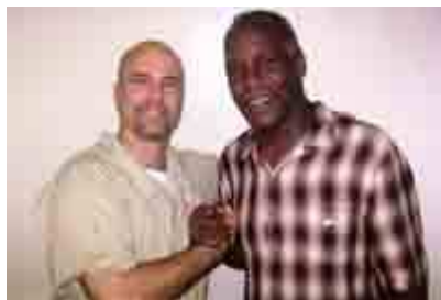
Nella foto a sinistra: Danny Glover con Gerardo Hernández

L'attore, famoso nel mondo fin da quando interpretò il film Fuga da Alcatraz, è sempre stato a fianco delle cause di giustizia sociale e ha sempre partecipato attivamente alle manifestazioni dei progressisti statunitensi.