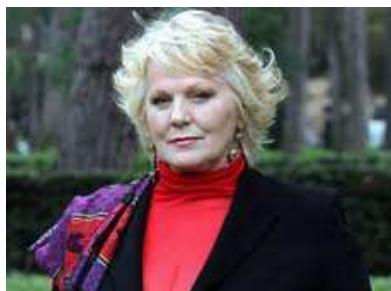
Katia Ricciarelli ha aperto la rassegna italiana a Cuba

Il concerto di apertura della XIV Settimana della Cultura Italiana, lunedì 21 novembre alle 5:00 del pomeriggio nella Basilica di San Francesco, è stato uno degli eventi artistici più importanti della stagione per la presenza del soprano Katia Ricciarelli, uno dei nomi leggendari nella scena musicale contemporanea. Con lei sono stati protagonisti della serata il tenore Francesco Zingariello e il pianista Roberto Corliano, che hanno dedicato il concerto alla commemorazione del 150° anniversario dell'Unità d'Italia. Altri punti salienti sono stati l'apertura, proprio quel giorno, dell'esposizione Magdalena di Valerio Beruti, una settimana di cinema italiano iniziata martedì 22 al Riviera, organizzato dall'ICAIC e dall'Associazione Ricreativa Culturale Italiana (ARCI); la presentazione mercoledì 23 dell'aggiudicazione del premio letterario Italo Calvino, frutto della collaborazione tra UNEAC e ARCI; il concerto jazz, nello