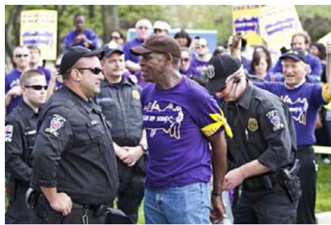
Nella foto l'arresto del 2010 mentre manifestava con gli operai della Sodexo nel Maryland