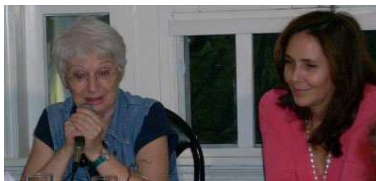
La nota scrittrice Bianca Pitzorno con Mariela Castro

La scrittrice italiana Bianca Pitzorno ha ricevuto la Distinzione all'Umità Dora Alonso, concessa dalla casa editrice cubana Gente Nuova e un riconoscimento speciale del Centro Nazionale di Educazione Sessuale (Cenesex), in onore alla sua rivelante carriera. Ambasciatrice di Buona Volontà dell'UNICEF e nominata al premio Hans Christian Andersen del