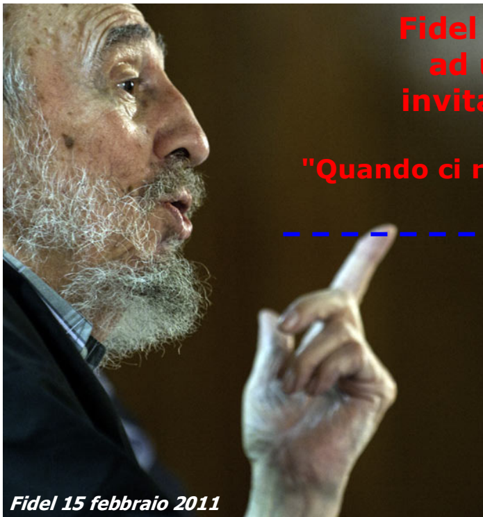
Fidel 15 febbraio 2011