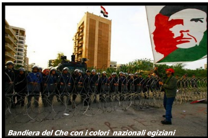
Bandiera del Che con i colori nazionali egiziani

Altre foto dal mondo arabo in fermento su http://amicuba.altervista.org/blog/