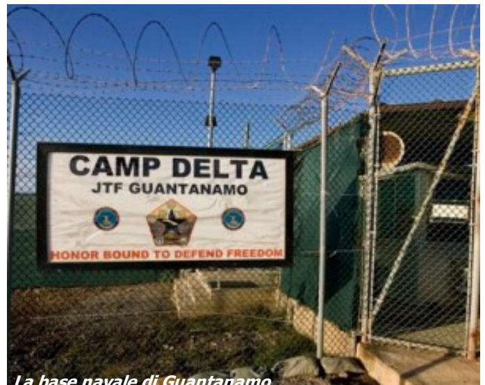
La base navale di Guantánamo