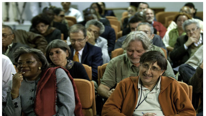
Pasqual Serrano e gli intellettuali a confronto con Fidel

Ha infine obbligato gli organizzatori a segnare una data nell'agenda. Questa è la cronaca di come Fidel Castro ha contagiato di vitalità ed entusiasmo una cinquantina di invitati della Fiera Internazionale del Libro di L'Avana.