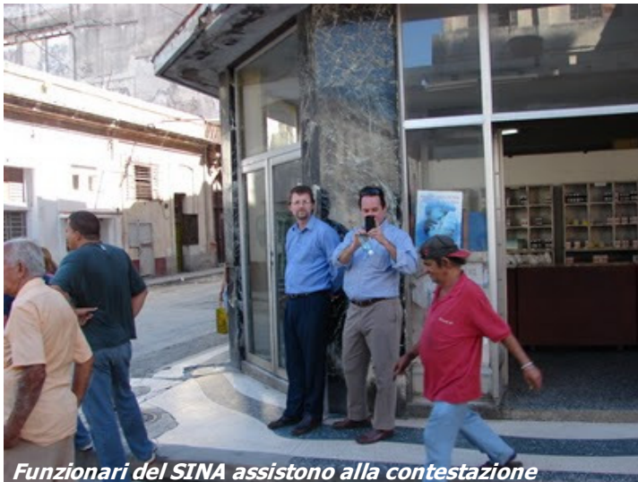
Funzionari del SINA assistono alla contestazione