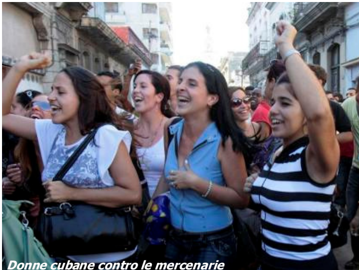
Donne cubane contro le mercenarie